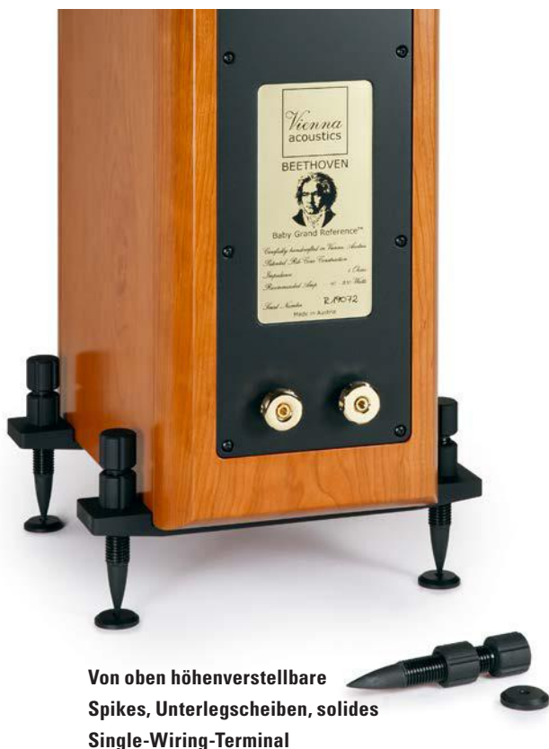
Von oben höhenverstellbare Spikes, Unterlegscheiben, solides Single-Wiring-Terminal

zunächst, dank der höhenverstellbaren Spikes waren die Boxen schnell in die Waage gebracht. Sofort hatten wir das Gefühl, dass die Beethoven wie für diesen Raum gemacht spielte und sich dort pudelwohl fühlte, als Charlie Byrd mit seinem Trio in „Shiny Stockings“ die Bühne betrat. Mit feinen dynamischen Abstufungen wurde das Geschehen dargestellt, die swingende Leichtigkeit extrem gut transportiert. Kein Frequenzbereich trat hervor, von Schärfe keine Spur, und auch in den unteren Registern dröhnte nichts, vielmehr erklang der Bass knochentrocken, schlank und mit präzise abgestimmtem Timing. Eine Eigenschaft, die sich auch beim Stück „Blues for Night People“ aus demselben Album zeigte, als Seldon Powell am Tenorsaxofon Kraft und Gefühl ebenso unter einen Hut brachte wie Byrd an der Gitarre. Beide Instrumente standen darüber hinaus schön plastisch im Hörraum, bei sehr guter Ortung. Auch der „Boss“ überzeugte bei „Sleepy Joe’s Café“. Getragen von einem Tieftonfundament, das eher knorrig als üppig ist, spielten die darüber angesiedelten Frequenzbereiche warm und vollmundig auf, mit reichlich Wiener Charme. Das hätte man dem grantelnden Beethoven gar nicht zuge- traut ... ■